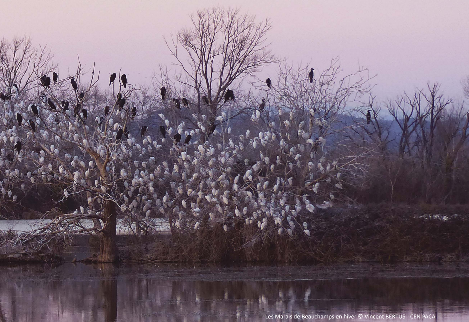
Les Marais de Beauchamps en hiver