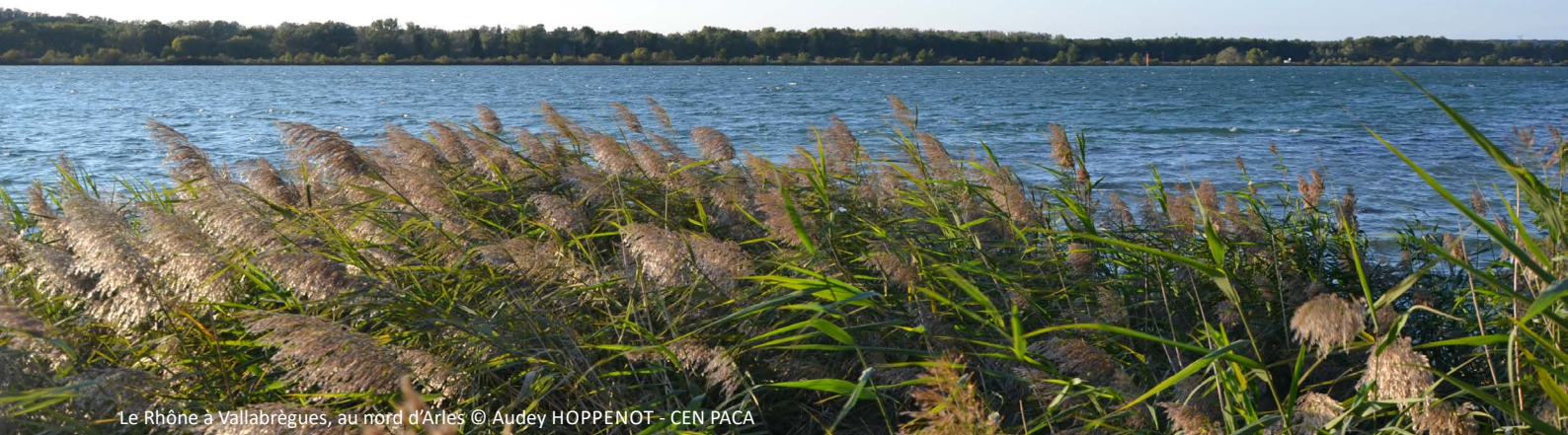
Le Rhône à Vallabrègues, au nord d'Arles

Depuis 2010 sont organisées des rencontres du réseau des acteurs des espaces naturels, du Rhône au départ, puis du Rhône et de la Saône.