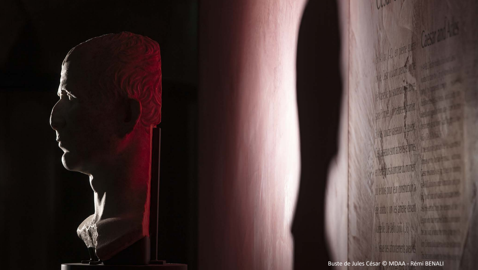
Buste de Jules César