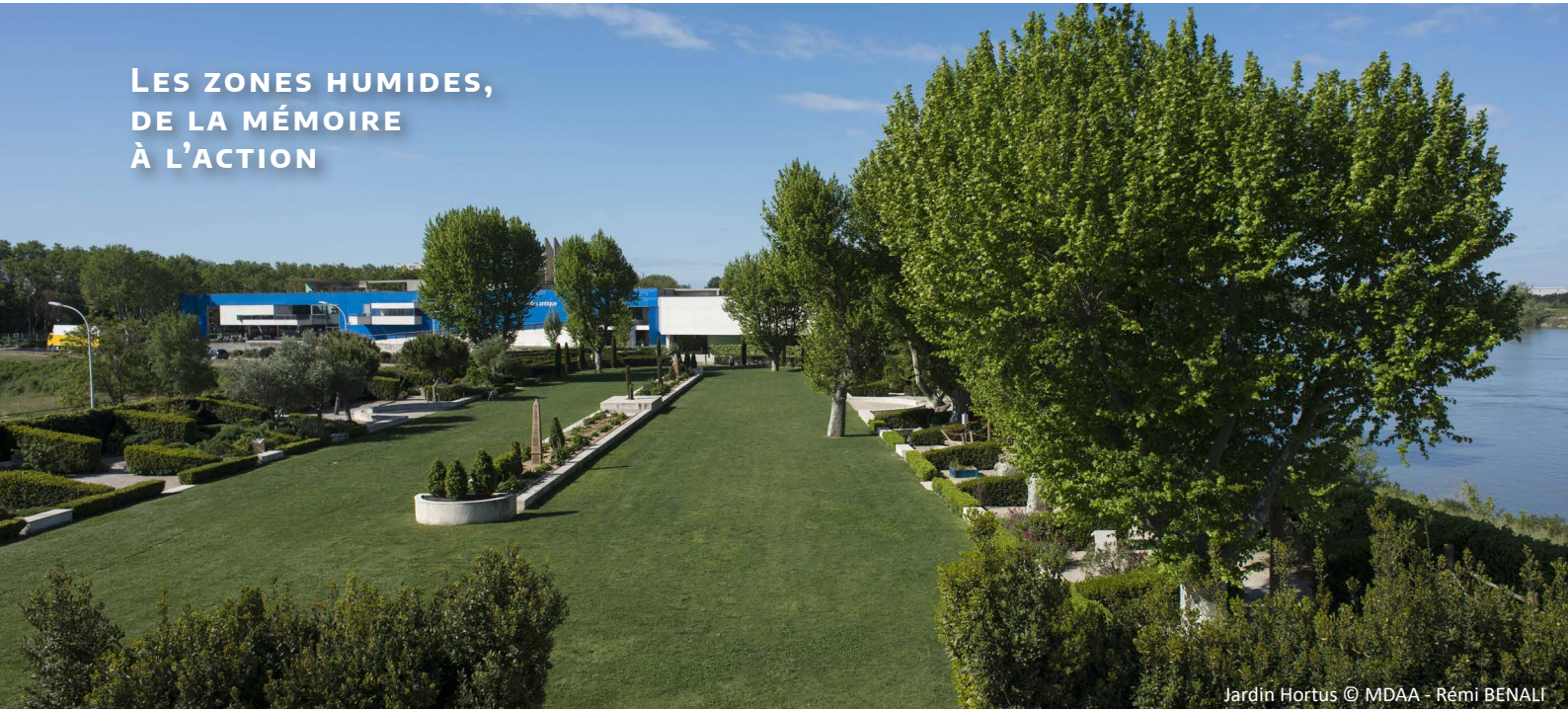
Jardin Hortus