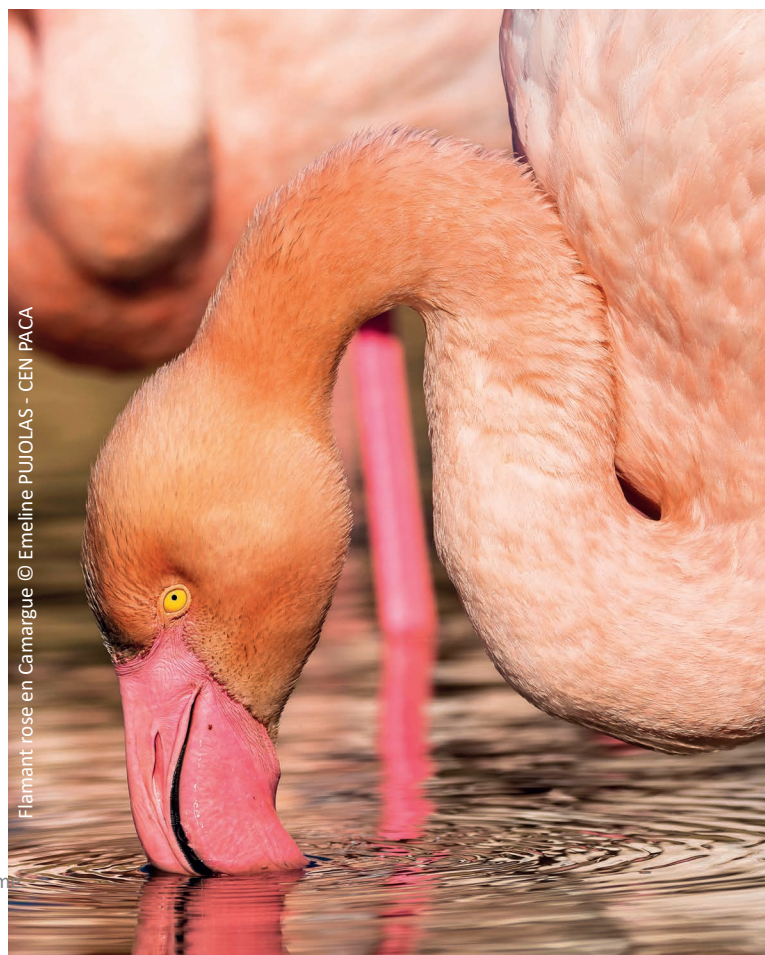
Flamant rose en Camargue

Ce séminaire est proposé dans le cadre de l'animation du réseau d'acteurs des espaces naturel Rhône & Saône portée par la Fédération des Conservatoires d'espaces naturels, et est coorganisé avec le Conservatoire d'espaces naturels de Provence-Alpes-Côte d'Azur.