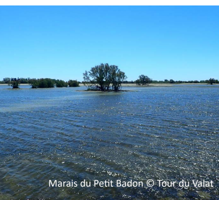
Marais du Petit Badon

Adresse du site : Marais de Beauchamp, 13200 Arles / 43.66504, 4.64890 (se garer au parking du stade de Pont-de-Crau)