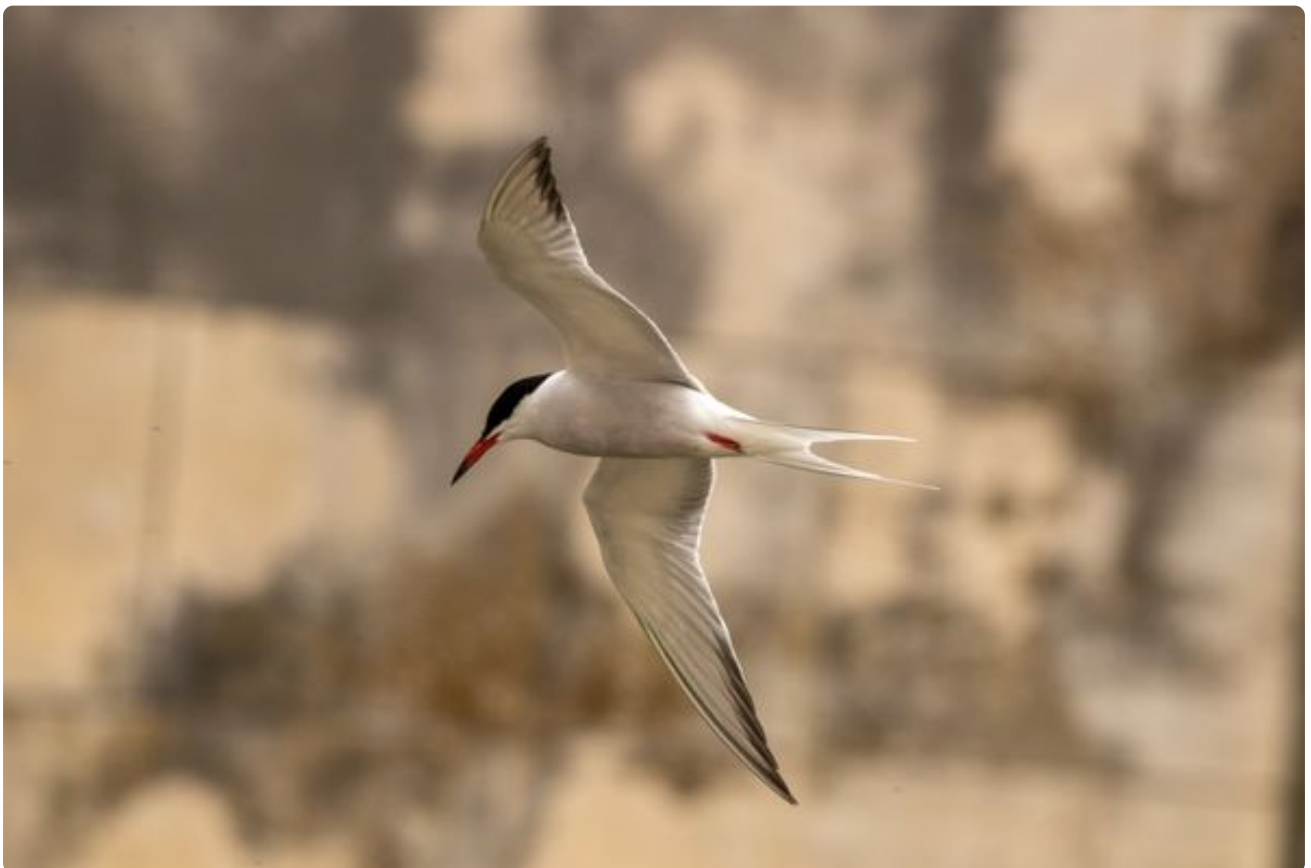
Sterne Pierregarin en vol