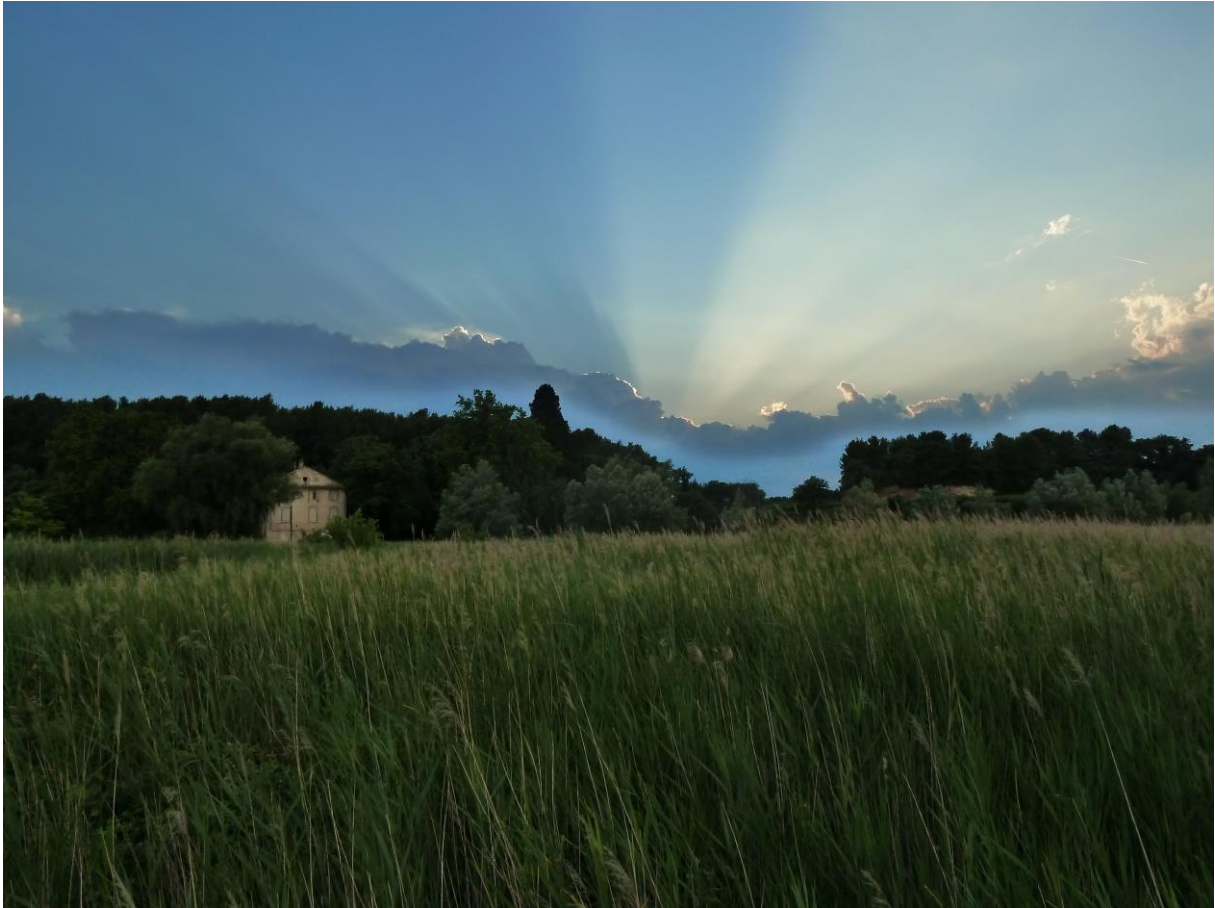
Etang Salé de Courthézon