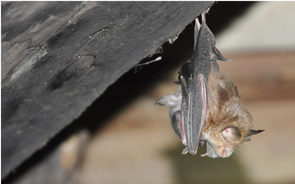
Petit Rhinolophe : une femelle et son jeune

Animation proposée par le Conservatoire d'espaces naturels d'Ariège