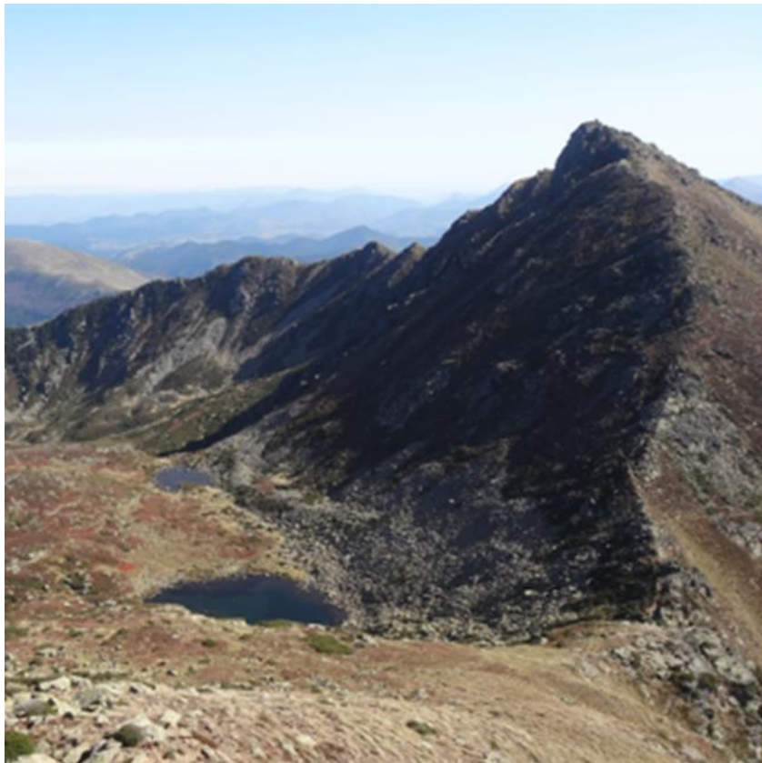
Réserve naturelle régionale du Massif du Saint-Barthélemy

Animation proposée par le Conservatoire d'espaces naturels d'Ariège