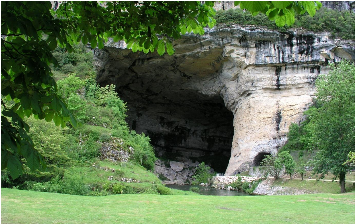
Grotte du Mas d'Azil