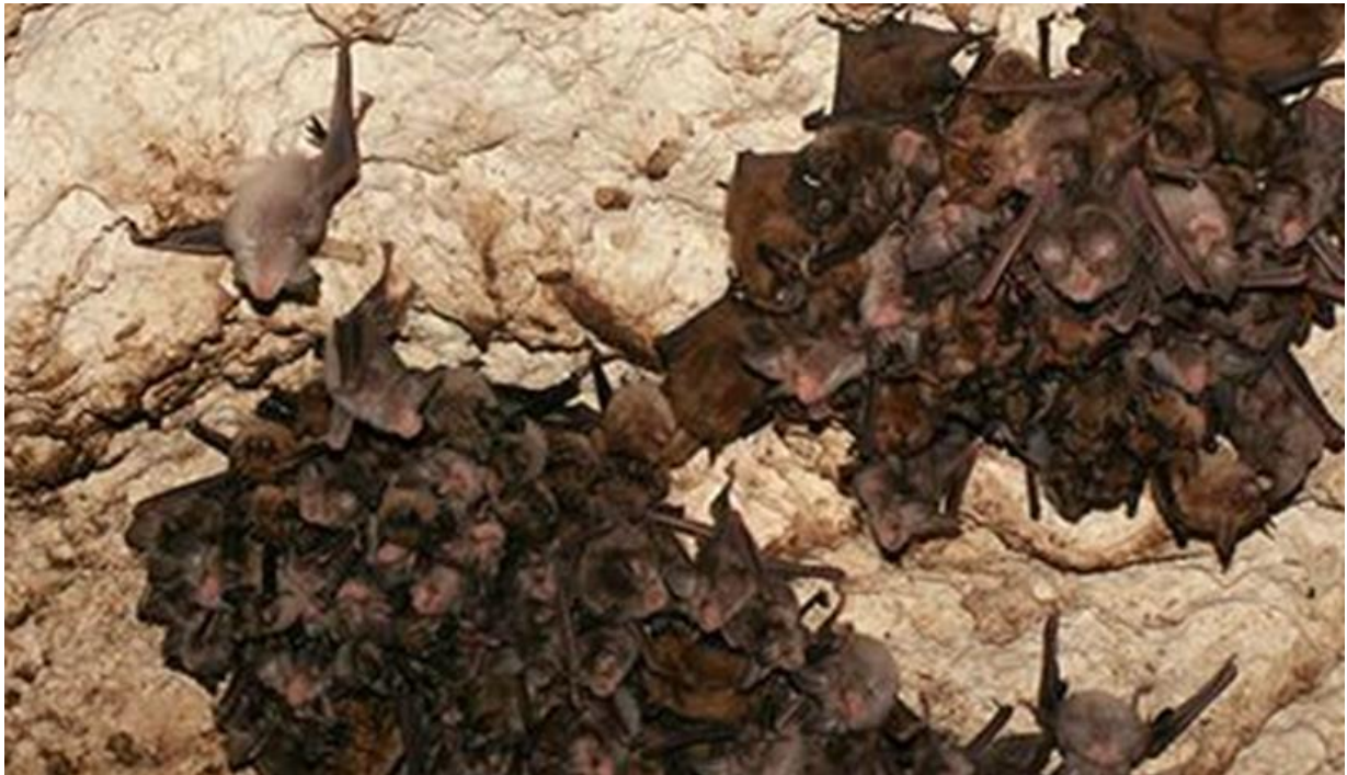
Chauves-souris dans les Caves du Bois des Roches

Animation proposée par le Conservatoire d'espaces naturels Centre-Val de Loire.