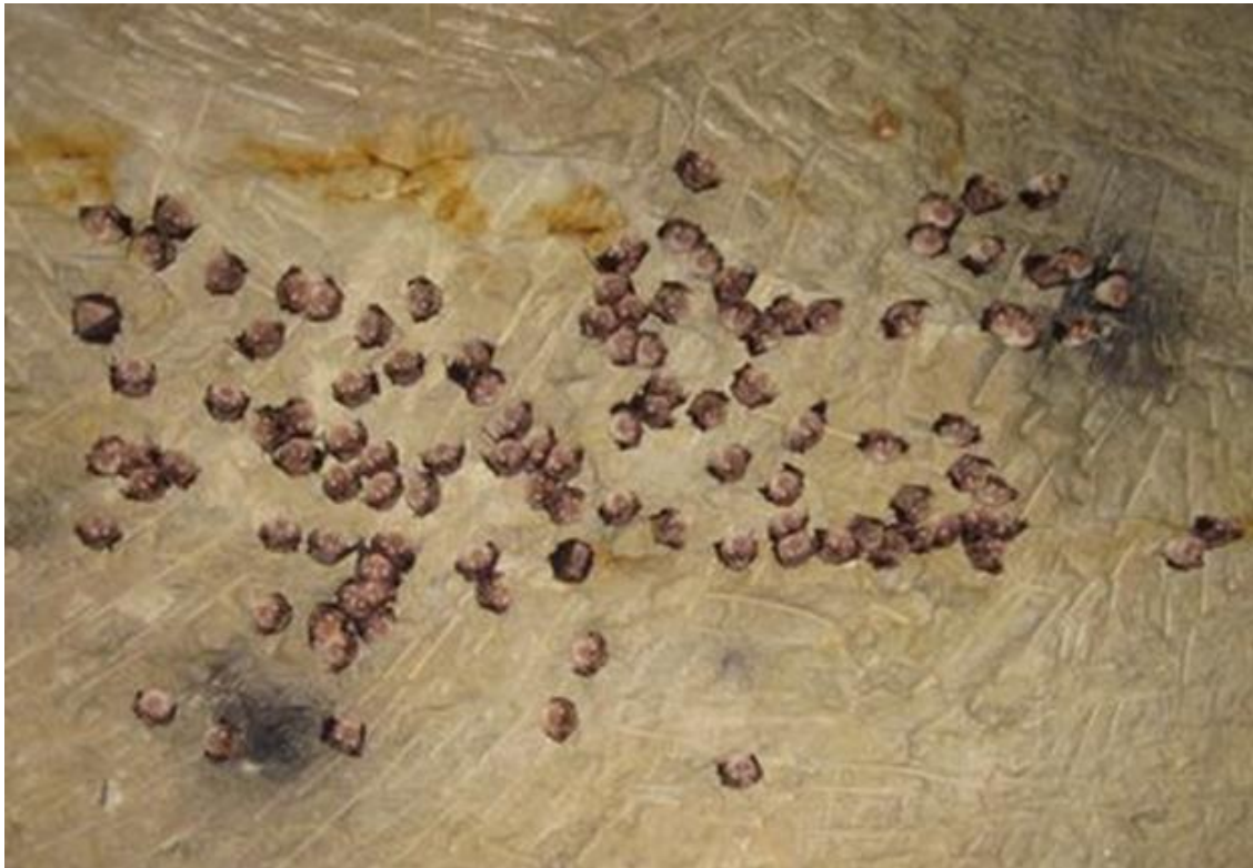
Chauves-souris dans les caves de Rigny-Ussé

Animation proposée par le Conservatoire d'espaces naturels Centre-Val de Loire.