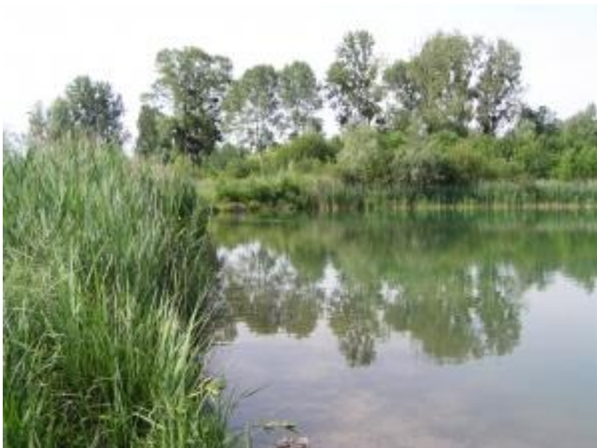
La sablière de Cercanceaux

https://www.cen-centrevaldeloire.org/tout-l-agenda/event/228-les-chauves-souris-de-cercanceaux