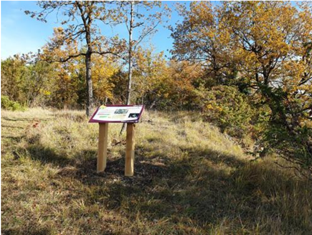
L'Eperon Murat