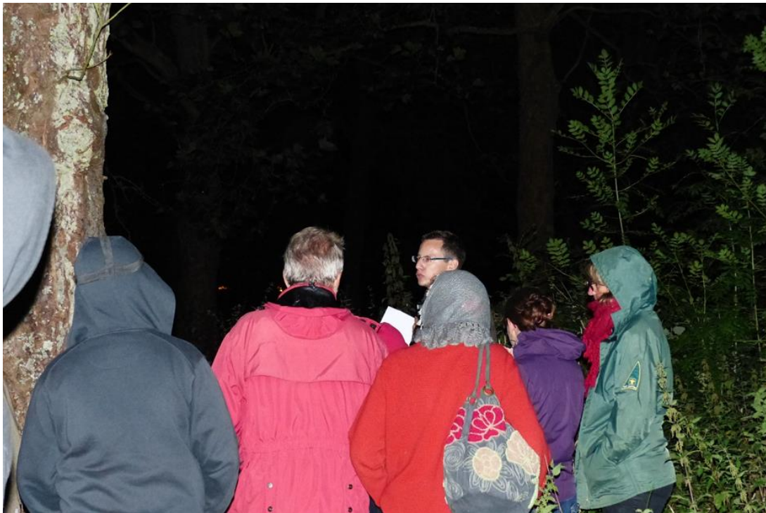
Ferté Vidame – Animation Nuit de la chauve-souris 2013

https://www.cen-centrevaldeloire.org/tout-l-agenda/event/252-sortie-chauve-souris-les-dents-de-la-nuit