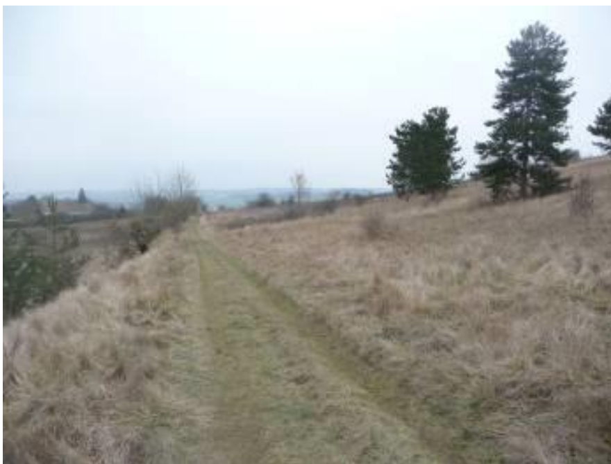
Les Côtes de Boncourt

Animation proposée par le Conservatoire d'espaces naturels Centre-Val de Loire, en partenariat avec la ville d'Oulins et l'association Bon'Eure de Vivre, dans le cadre de Nuit de la chauve-souris. https://www.cen-centrevaldeloire.org/tout-l-agenda/event/43-souriez-aux-chauves-souris