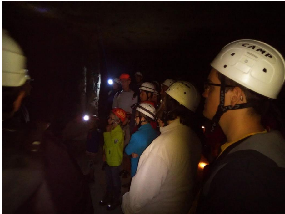
Caves de Beaulieu – Animation Nuit de la chauve-souris 2016

Animation proposée par le Conservatoire d'espaces naturels Centre-Val de Loire dans le cadre de la 25e Nuit internationale de la chauve-souris. https://www.centrevaldeloire.org/tout-l-agenda/event/29-nuit-de-la-chauve-souris