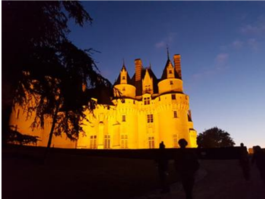
Château d'Ussé