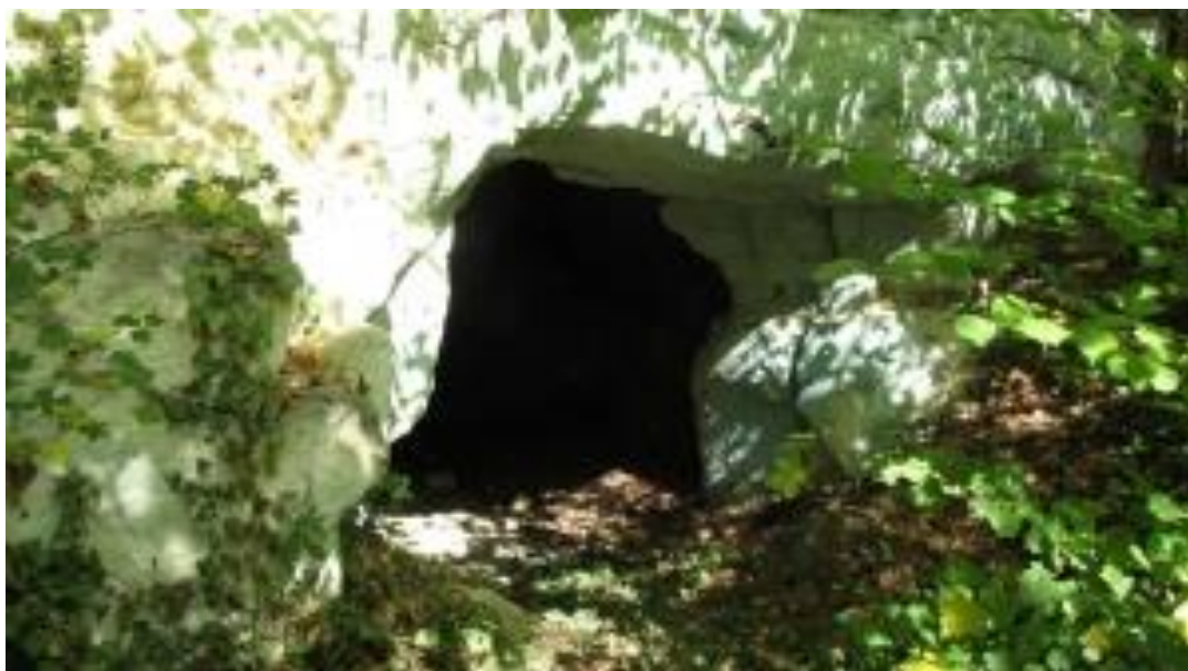
Les Caves du Tranger

https://www.cen-centrevalde Loire.org/tout-l-agenda/event/23-nuit-de-la-chauve-souris