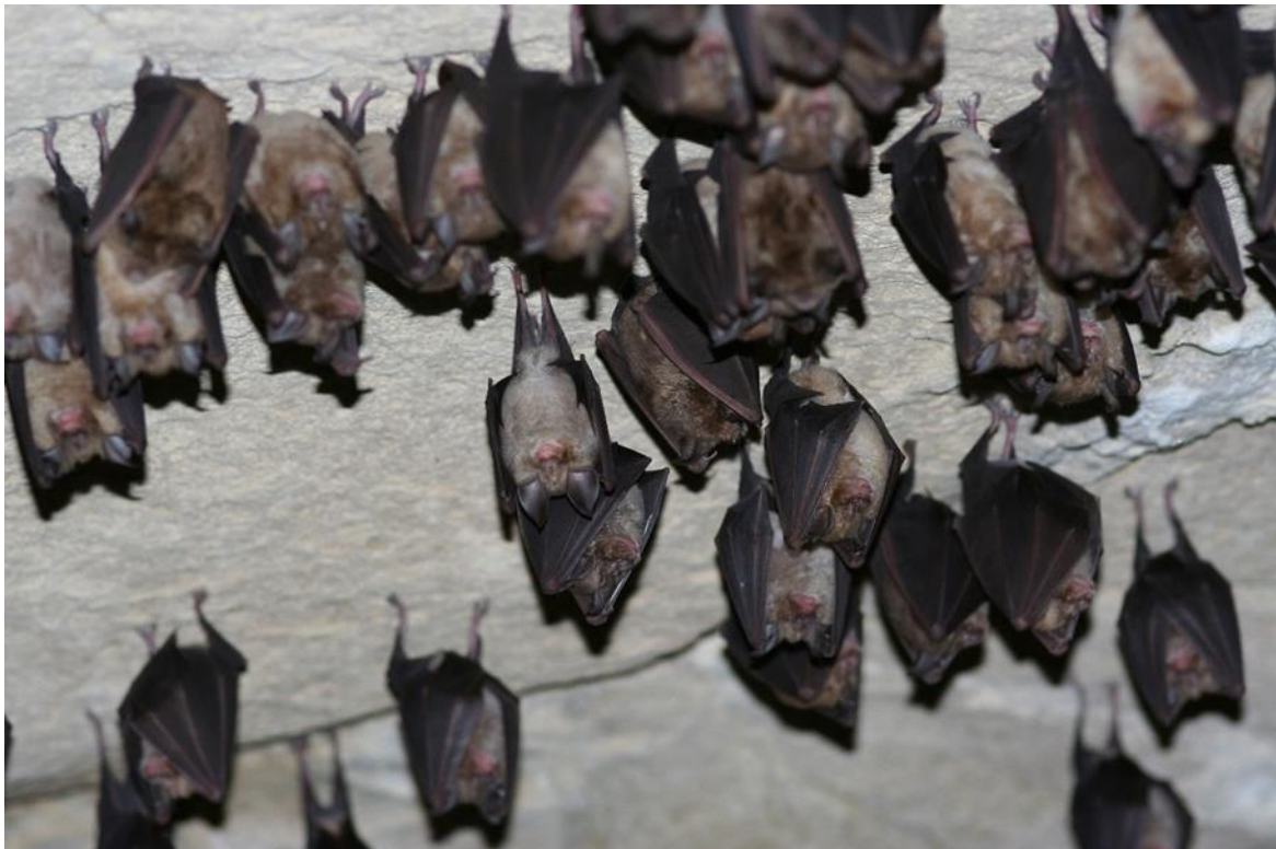
Colonie de grands Rhinolophes

Animation proposée par le Conservatoire d'espaces naturels Centre-Val de Loire, dans le cadre de Nuit de la chauve-souris en partenariat avec Chartres Métropole sur l'ENS de la Vallée de l'Eure. https://www.cen-centrevaldeloire.org/tout-l-agenda/event/65-les-chauves-souris-a-luisant