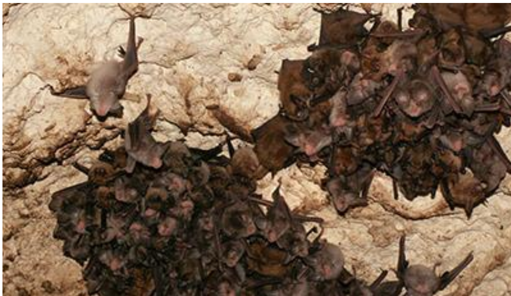
Chauves-souris dans les Caves du Bois des Roches

https://www.cen-centrevalde Loire.org/tout-l-agenda/event/11-nuit-de-la-chauve-souris-au-coeur-de-la-reserve-naturelle-du-bois-des-roches