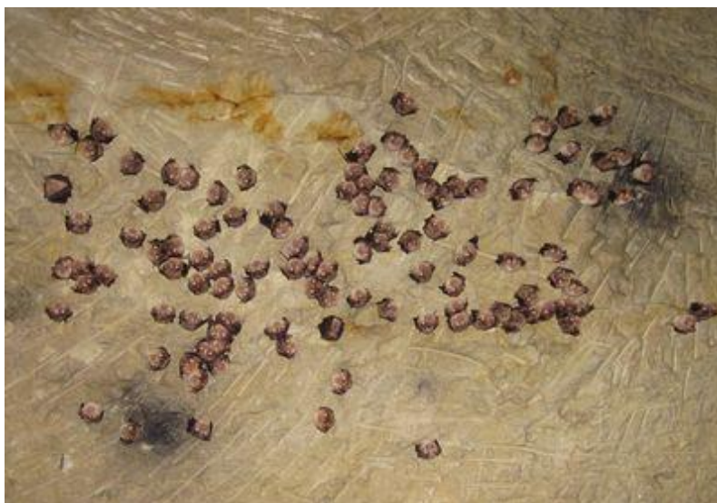
Chauves-souris dans les caves de Rigny-Ussé

https://www.cen-centrevaldeloire.org/tout-l-agenda/event/22-nuit-de-la-chauve-souris