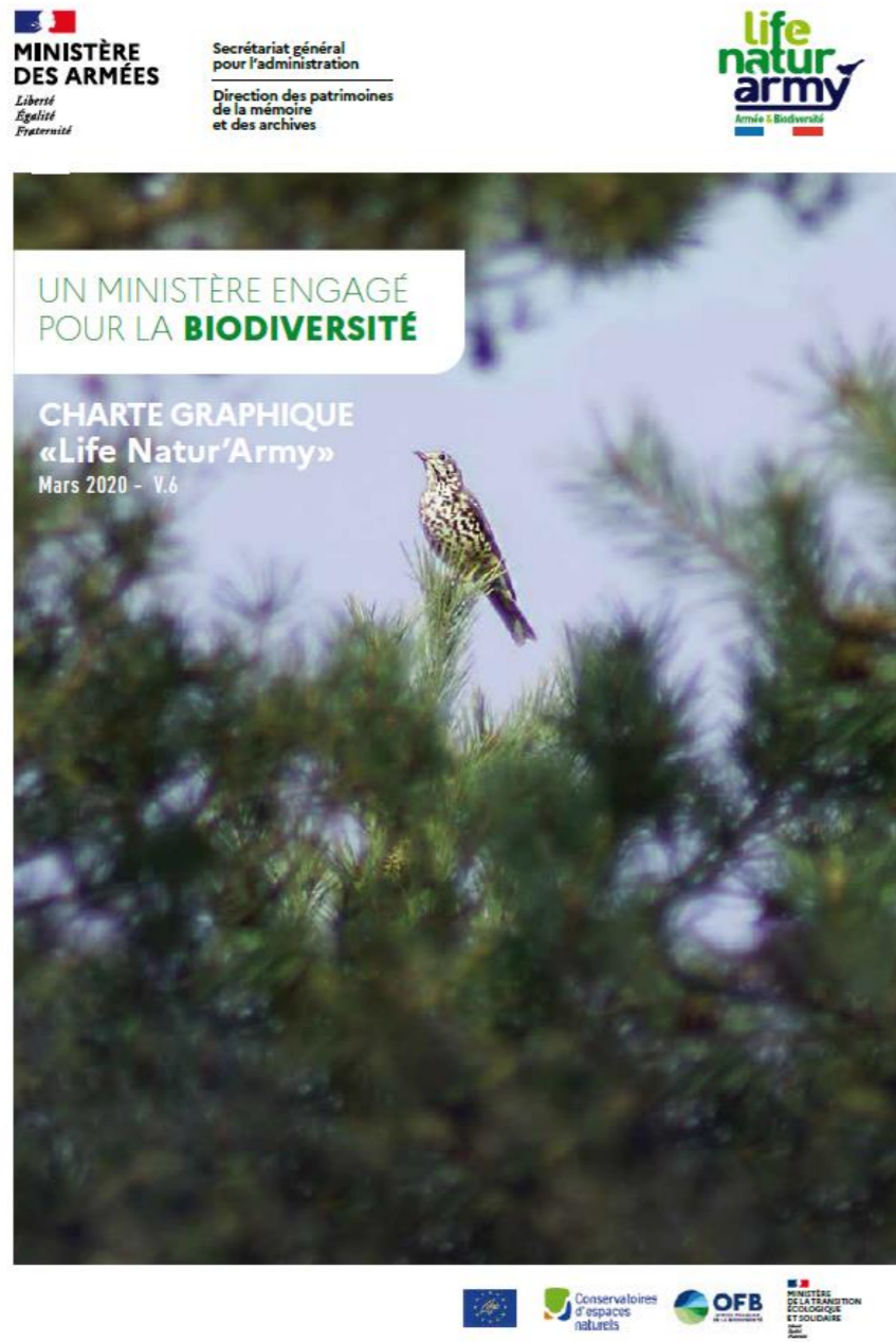
Annexe 2 : Moodboard inspiré des chartes graphiques des projets LIFE (exemple du LIFE NaturArmy en attente de la charte graphique du LIFE Valbonne)